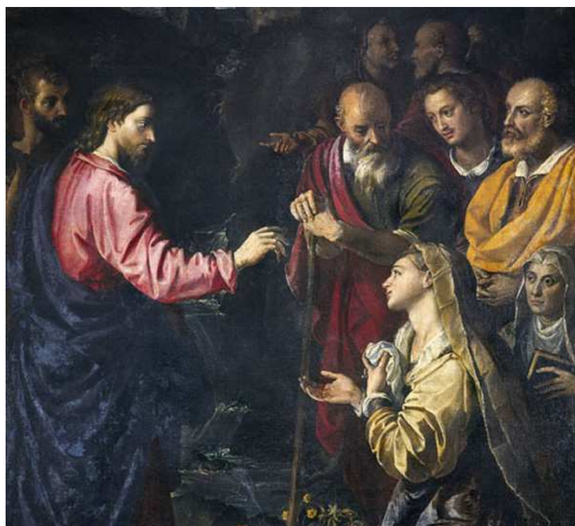
Gesù e la Cananea di Alessandro Allori, detto il Bronzino